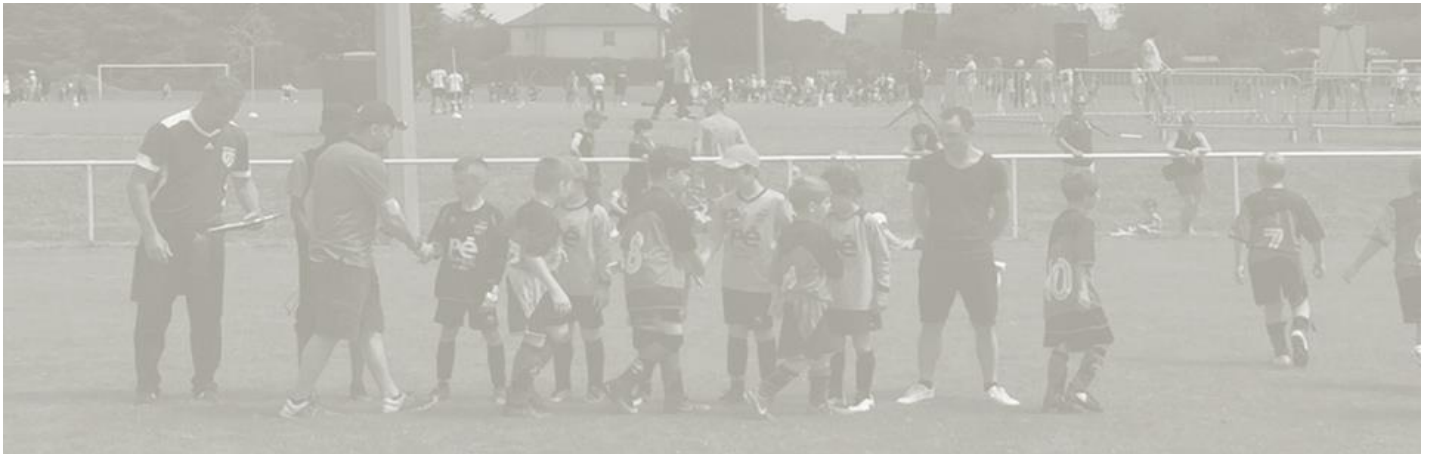
Le protocole du Fair-Play respecté avant chaque rencontre