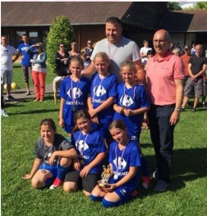
L'équipe vainqueur du Challenge Lilou, le FC Beffes St Léger et le Président du District du Cher de Football.

Une bien belle journée où le fair-play et la convivialité de l'organisation des bénévoles ont ravi le nombreux public.