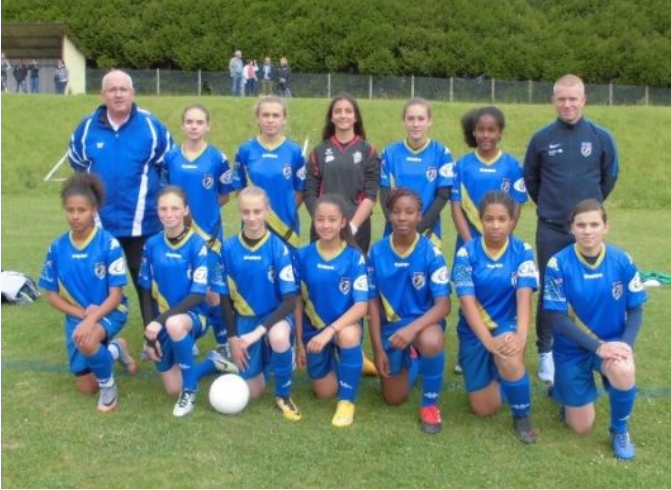
La Sélection U14F