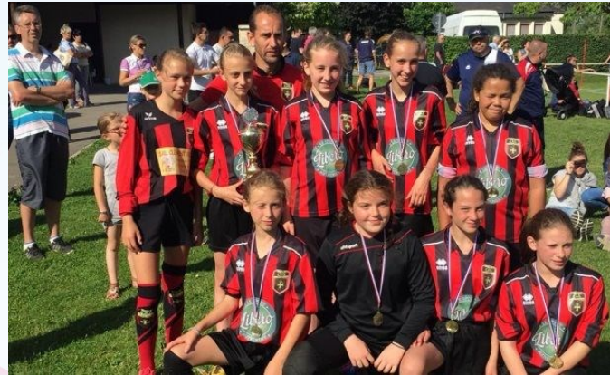
L'équipe des U13F du CA Guerchois

La traditionnelle journée Karine LUBERNE, s'est déroulée le samedi 16 juin sur les installations sportives de l'US STE Solange. C'est sous un soleil radieux que les finales des différentes catégories se sont disputées. Le match phare de la journée qui opposait le SL Chaillot au FR Ids ST Roch (Challenge JP SIMIER) a tenu toutes ses promesses. Un public nombreux est venu assister aux différentes rencontres. Le Challenge LILOU âprement disputé, a vu le FC Beffes disposer du Bourges 18. Le CA Guerchois s'est quant à lui octroyé les challenges U15F aux dépens de l'Entente Dun/Charenton et U13F contre le Bourges 18. La finale U19F a vu l'équipe du Bourges 18 dominer l' US Dun/Auron.