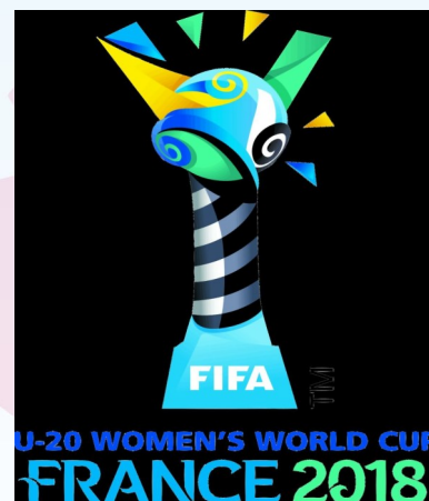
LOGO DE LA COUPE DUMONDE U20F

C'est en Bretagne que se déroulera dès le 05 aout 2018, la Coupe du Monde des moins de vingt ans féminines. Quatre sites ont été retenus pour accueillir les 16 équipes qualifiées pour le tournoi final. Vous pourrez vous rendre à Saint-Malo, Dinan/Léhon, Concarneau et Vannes pour soutenir vos équipes préférées. Les jeunes françaises évolueront dans le groupe A avec les équipes du Ghana, de la Nouvelle Zélande et des Pays-Bas. Leurs deux premiers matchs se dérouleront à Vannes et le troisième à Saint-Malo. A noter que la finale se jouera le 24 aout 2018 au stade de la Rabine à Vannes.