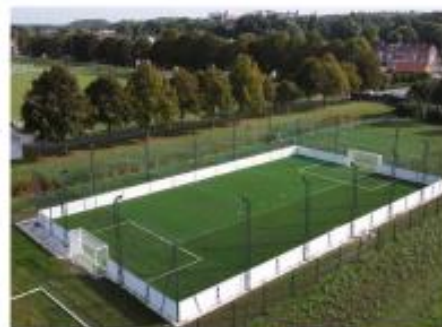
MAIRIE DE SALOUEL (80)