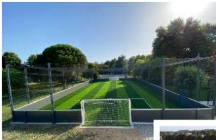
MAIRIE DE DONZENAC (19)