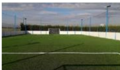
MAIRIE DE COUFFÉ (44)