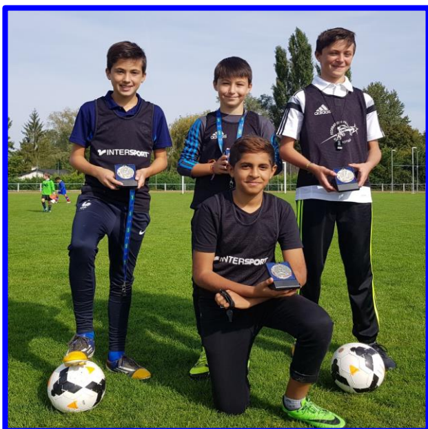
L'opération "Arbitre Ton Foot" a commencé dès la Journée de rentrée à La Chapelle St Ursin