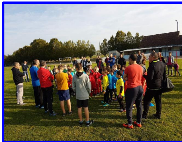
La journée de rentrée U9 organisée par l'Ent Cantonale Angillonnaise